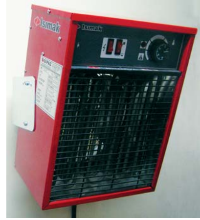
Duvar Askı Aparatı Seçeneği